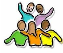
V I E R I N G