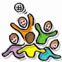
S P E L

Praten en luisteren, ontspanning, bezig zijn en bezinnen, voorbereiden en uitvoeren, wisselen elkaar ritmisch af. De taak van de stamgroepleider is om dit zo harmonieus mogelijk te laten plaats vinden binnen. We ondersteunen de basisactiviteiten met een lesrooster dat bij ons in de lijn van het voorgaande het ritmische weekplan wordt genoemd.