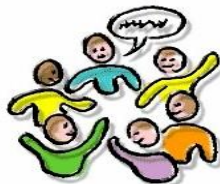
G E S P R E K