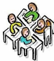
W E R K