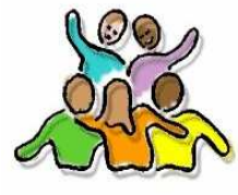
V I E R I N G