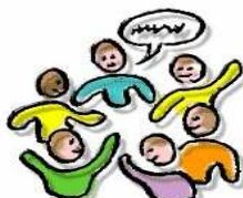
G E S P R E K